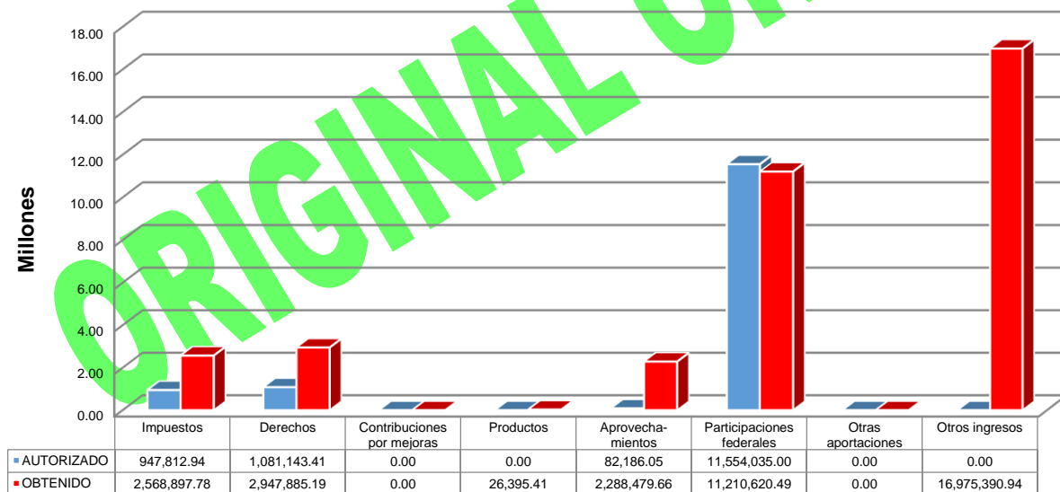
GRÁFICA 1 INGRESOS

Otros ingresos: Emisiones Bursátiles (Bursatilización) $177,158.05, FOPAIDE $2,500,000.00, Fondo de Contingencias Económicas $13,000,002.00, Desarrollo de Zonas Prioritarias $177,158.05, 20% de Energía Eléctrica de lo Facturado por CFE $432,400.24, Recaudación diaria $688,672.60.